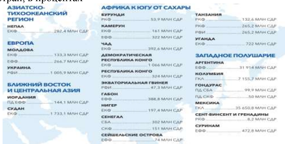
Рисунок 1 Уровень долга в процентах от внутреннего валового продукта стран, в процентах