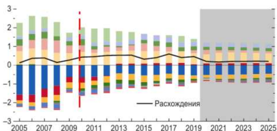
Рисунок 3 Сальдо текущих операций по всему миру МВФ, в процентах ВВП.

Сальдо текущих операций МВФ снижается до минимума с 2020 года – рисунок 3.