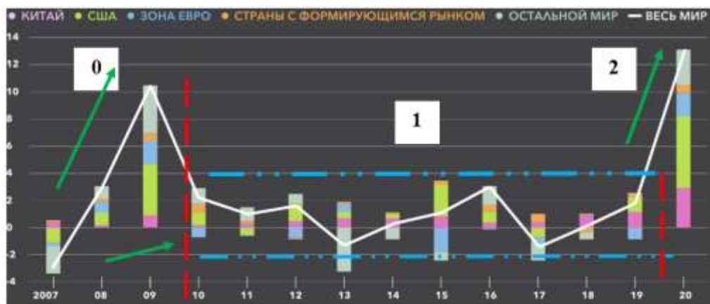
Рисунок 1 Изменение глобальных государственных обязательств МВФ, в процентах ВВП.

Объём мировой торговли характеризуется условным постоянством в относительных показателях ВВП стран-участников, которая характеризуется резким снижением к 2020 году и таким же резким восстановлением – рисунок 2.