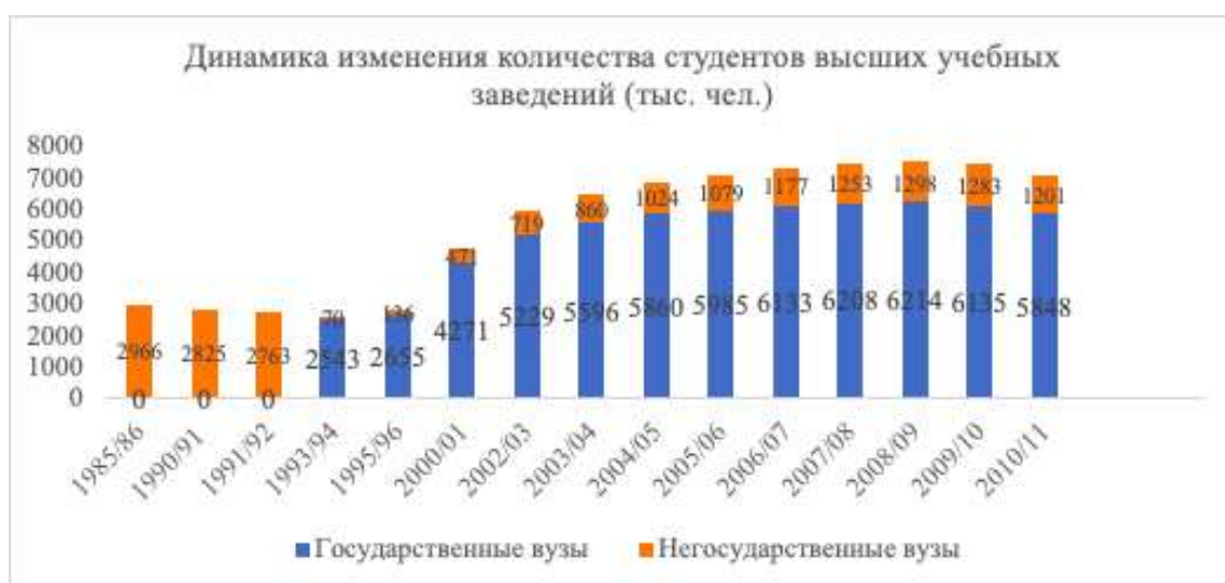
Диаграмма 3. Динамика численности студентов в вузах до 2013 г.

Динамику изменения количества обучающихся в негосударственных вузах, это можно проследить по диаграмме 3; 4 [1].