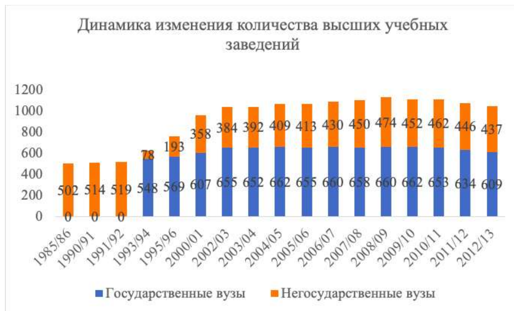
Диаграмма 1. Динамика изменения количества вузов до 2013 г.

Так, если в 1993 году негосударственные вузы составляли лишь 7,8 % от общего числа высших учебных заведений в России, то в 2012/13 году их доля увеличилась до 41,8 %. Устойчивый рост числа негосударственных вузов можно проследить по диаграмме 1 [1].