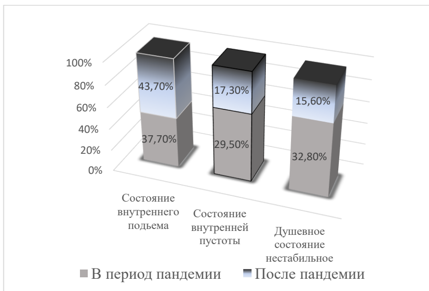
Рисунок 3. – Показатели оценки студентами своего душевного состояния.

При оценке своего настроения более половины (55,7%) опрошенных студентов в период пандемии отметили, что им свойственно оптимистическое настроение, после пандемии на оптимистическое настроение указали 58,6%, на преобладание пессимистического настроения в период пандемии указали 18 % студентов, после пандемии 15,7% опрошенных (см. рис.4).