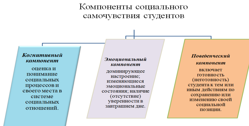
Рисунок 1- Структура социального самочувствия студентов.

социального самочувствия студентов включает в себя три компонента: эмоциональный, когнитивный и поведенческий ( см. рис.1)