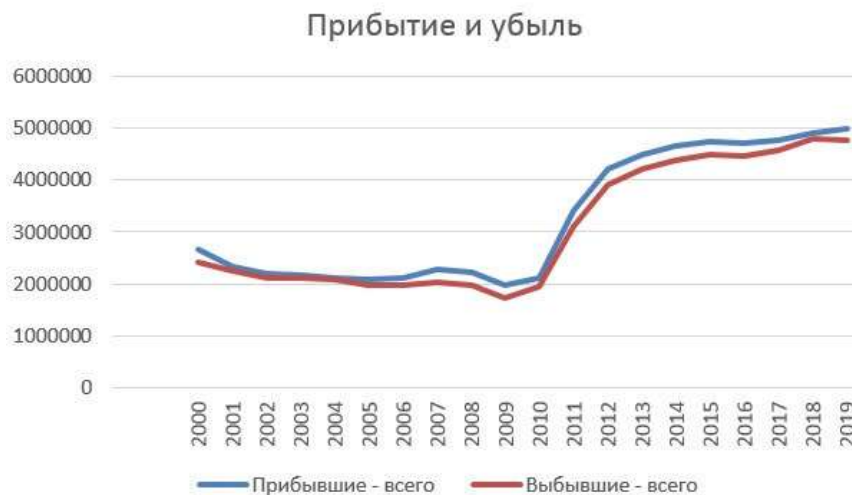
Рисунок 1 – Динамика прибытия и убытия мигрантов в Россию и из России [5]

Что касается прогнозов миграционных процессов в мире и участия РФ в них, то сейчас в виду сложных условий мировой пандемии их составлять довольно сложно. Если ситуация в российской экономике станет лучше, число приезжих в страну увеличится и наоборот. Но обвального роста можно ожидать только в случае каких-либо природных или политических катаклизмов в ближнем зарубежье.