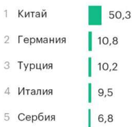
Рис. 1 – Страны-источники иностранных мигрантов в Россию на 1.07.2019 [3]

Центрами притяжения мигрантов, как и в предыдущие годы, остаются Московская и Санкт-Петербургская агломерации, а также Краснодарский край.