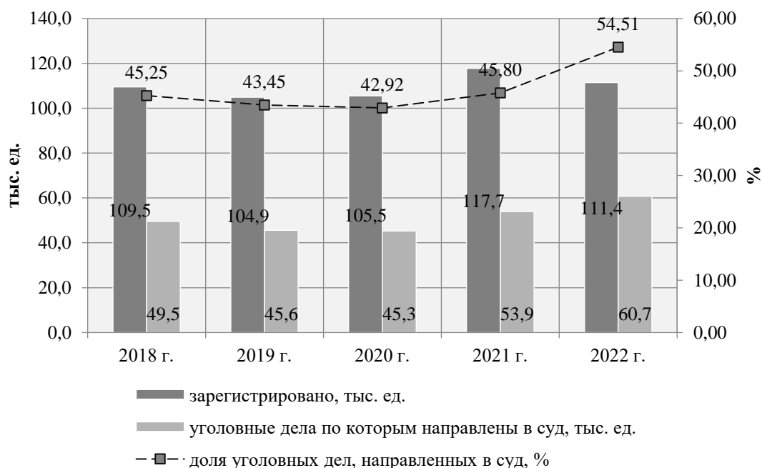
Рисунок 1 – Показатели состояния экономической преступности в РФ [6].

Опираясь на архивные данные МВД РФ, нами определена восходящая линия тренда, характеризующая число преступлений экономической направленности, совершённых в нашей стране (рисунок 1).