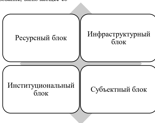
Рисунок 1. Структурные компоненты модели развития культурно-познавательного туризма в регионе.

Определение структурных компонентов модели составляет её аналитическое ядро, поскольку именно состав и характер элементов системы предопределяют логику функциональных связей между ними [6]. Структурные компоненты модели развития культурно-познавательного туризма представлены на рисунке 1.