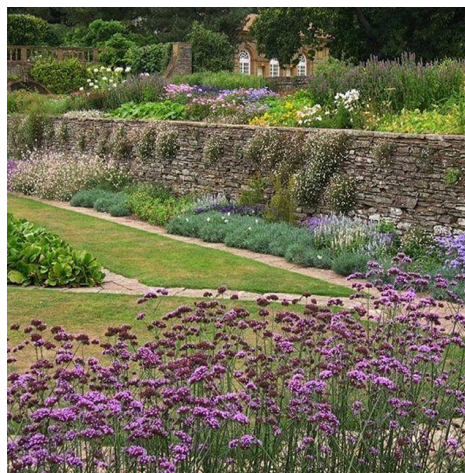
https://i.pinimg.com/736x/9b/f3/96/9bf39697d5f9cf3cb62195dabf990569.jpg Рис. 2. Хестеркомбе. Партерный сад. Бордюр.

При создании партера Латченс вдохновлялся садами эпохи Возрождения и барокко, поэтому партерный сад не только регулярен, но и располагается ниже прилегающей территории подобно буленгину в барочных садах. Однако оформление перепада уровней в Хестеркомбе демонстрирует новый прием ландшафтного решения (рис. 2).