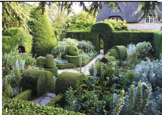
Рис. 6. Hidcote Manor. «Сад с колоннами».

https://i.pinimg.com/736x/9a/99/c4/9a99c41e31fc144407130be521018d71.jpg