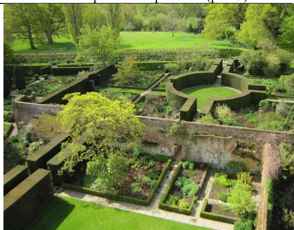
Рис. 8. Сад замка Сиссингхерст (Sissinghurst Castle Garden). «Белый сад».

https://avatars.mds.yandex.net/i?id=3cff714c9054642182874cc1fc90f7bb_1-9181971-images-thumbs&ref=rim&n=13&w=1600&h=1201