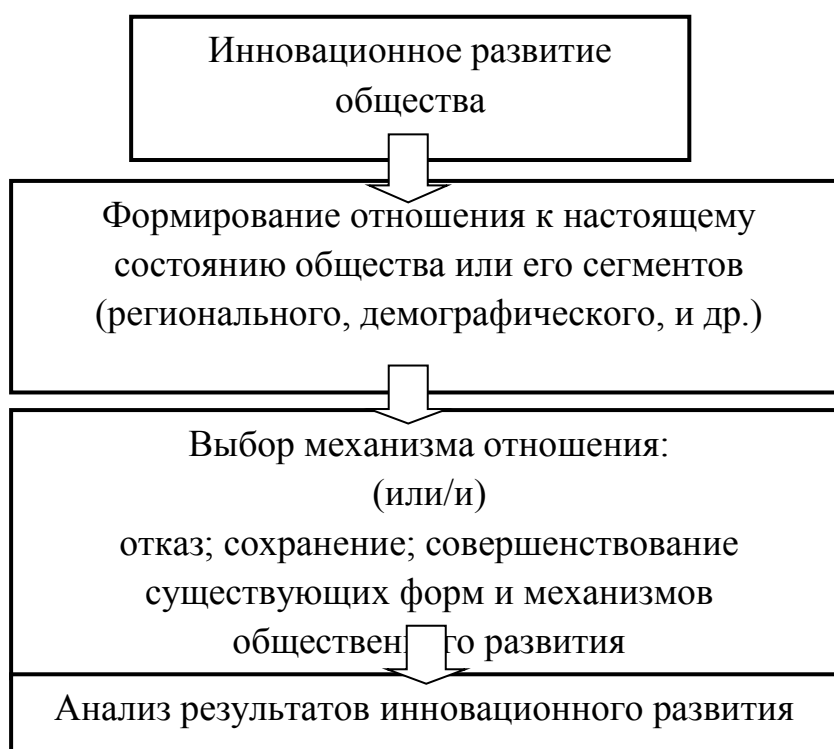
Рис. 1. Механизм инновационного развития общества.

Именно поэтому целесообразно предложить некоторые методологические принципы анализа механизмов реализации инновационного социального развития, одним из которых является социальная консолидация общества и его составляющих. Итак, рассмотрим эти принципы на следующем рисунке, отражающем схему механизма инновационного развития общества: