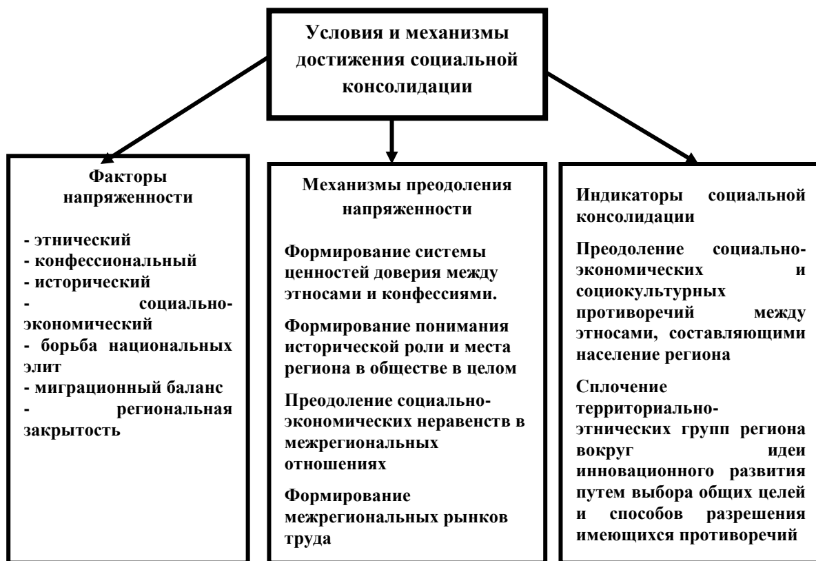
Рис. 3. Условия и механизмы достижения социальной консолидации

Выводы. Итак, методологической основой данного исследования стали принципы мультидисциплинарного и полипарадигмального подходов, что соответствует междисциплинарному характеру самой пространственной науки и разработанному в ее границах подходу. Инновационное развитие полиэтнического региона, каким является Юг России, по нашему мнению, невозможно: