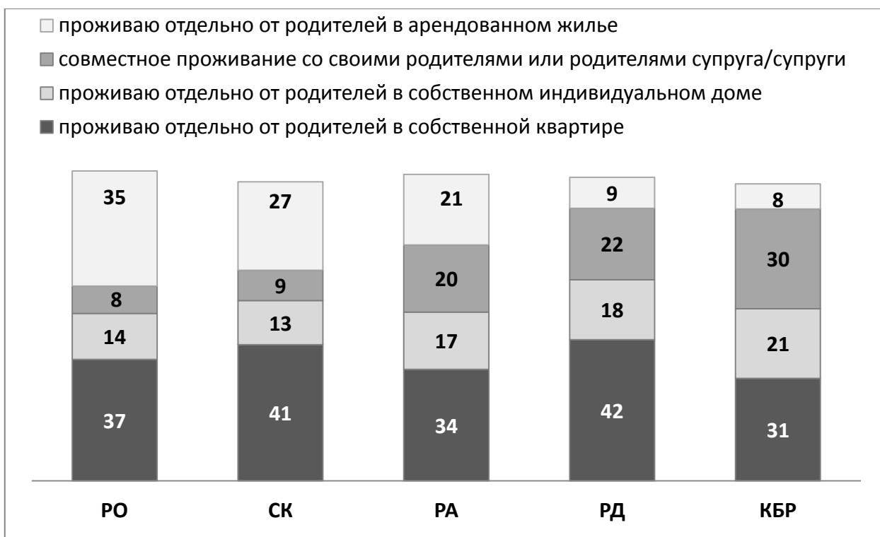
Рис. 4. Укажите наиболее вероятный вариант Ваших жилищных условий через 10 лет (один вариант ответа, в %).

объясняется сохранением среди значительной части населения региона ориентацией на модель расширенной патриархальной семьи [10; 11; 12].