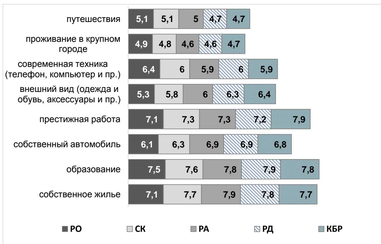
Рис. 2. О каких проявлениях собственного благосостояния молодым людям следует позаботиться в первую очередь? (оцените факторы благосостояния в порядке убывания: самое значимое – 10, незначимое – 1) (в средних баллах).

Современная техника (смартфон, компьютер и пр.) также входит в набор показателей экономического благополучия (от 5,9 до 6,0 средних баллов во всех сегментах). Обращает на себя внимание то, что для студентов из республик Северного Кавказа более важными, чем гаджеты являются параметры внешнего вида (одежда и обувь, аксессуары, прическа и пр.) (от 6,0 до 6,4 средних баллов). Путешествия и городской образ жизни замыкают список проявлений благополучия. На этом фоне студенты Ростовской области и Ставропольского края оценивают возможность путешествий немного выше, чем представители республиканского сегмента. (Рис. 2).