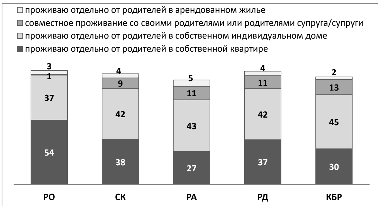
Рис. 3. Укажите желаемый вариант Ваших жилищных условий через 10 лет (один вариант ответа, в %).

Как видим, наличие собственного жилья является важнейшим компонентом экономического благосостояния молодежи Юга России. В исследовании задавался вопрос о желаемом и наиболее вероятном варианте жилищных условий студентов через десять лет. В первом случае, больше всего хотели бы жить отдельно от родителей в собственной квартире молодые люди Ростовской области (54%), тогда как студенты Ставропольского края и северокавказских республик чаще демонстрируют установки на проживание в собственном индивидуальном доме (от 42% до 45%). Еще около десятой доли опрошенной молодежи северокавказского сегмента ориентированы на совместное проживание с родителями. (Рис. 3).