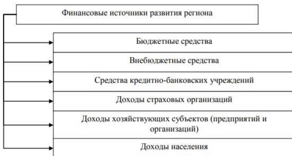
Рисунок 1 - Финансовые источники развития региона.

Все указанные отрасли поступления денежных средств выступают в совокупном размере, как бюджет определенного региона, а следовательно, и объектами охраны в рамках экономической безопасности страны.