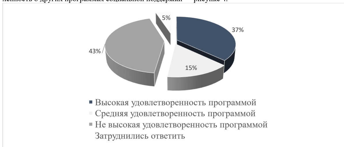
Рисунок 4 – Удовлетворенность муниципальными лечебно-оздоровительными для граждан пожилого возраста.

Результаты опроса об удовлетворенности лечебно-оздоровительными программами отражены на рисунке 4.