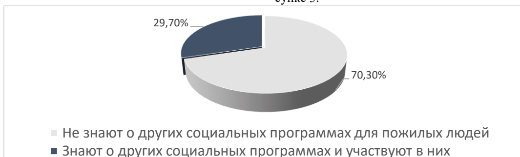
Рисунок 3 – Данные об осведомленности респондентов о реализуемых в г. Новосибирске программах социальной поддержки пожилых лиц.

Данные об осведомленности респондентов о реализуемых в городе Новосибирске программах социальной поддержки пожилых лиц представлены на рисунке 3.