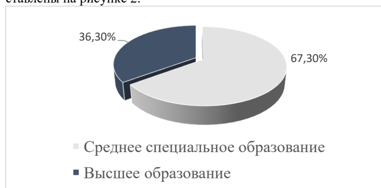
Рисунок 2 – Структура респондентов с учетом уровня образования.

Респонденты, на момент проведения опроса, относились к группе пенсионеров, имеющих в прошлом разный трудовой стаж, профессиональную принадлежность, уровень образования и квалификации. Данные об уровне образования респондентов представлены на рисунке 2.