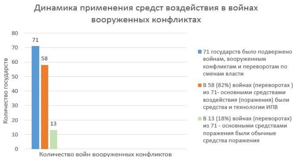
Рис. 1. Динамика применяемых средств в войнах, вооруженных конфликтах и переворотах по смене власти в период с 1991 г. по 2021 г.

Согласно данным Министерства внутренних дел Российской Федерации, в последнее десятилетие преступления экстремистской направленности в подавляющем большинстве перешли в категорию деяний, совершаемых в информационном пространстве. Так, в ходе анализа официальной статистики количества приговоров по «антиэкстремистским» статьям Уголовного кодекса РФ была сформирована диаграмма, иллюстрирующая данный показатель в ретроспективной динамике с 2007 года по настоящее время (рис. 2) [1]