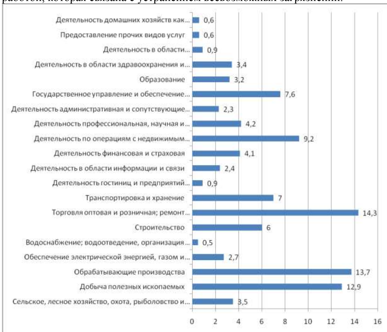
Рисунок 1 - Отраслевая структура России, %

Самую меньшую долю от общего объема занимает сфера, которая связана с водоснабжением, канализацией, утилизацией отходов, а также работой, которая связана с устранением всевозможных загрязнений.